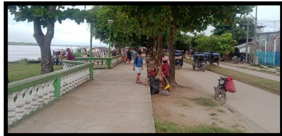
Barrido de calles