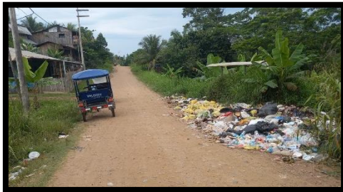
Punto de acumulación de RSM